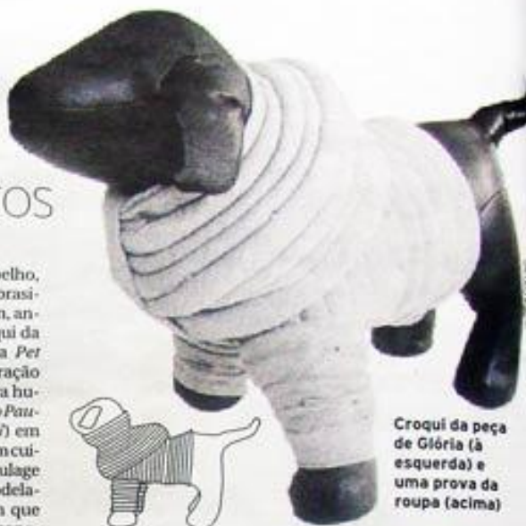
Croqui da peça de Glória (à esquerda) e uma prova da roupa (acima)

Já é um mercado de sucesso, agora no inverno vemos vários cachorros com roupinhas lindas, não sei mensurar em relação ao mercado de moda, mas acredito que já tenha o seu glamour.